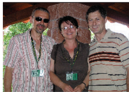
Fotografie prvého ročníka májových pivníc v roku 2007: