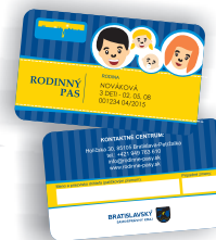
Karta Rodinný pas