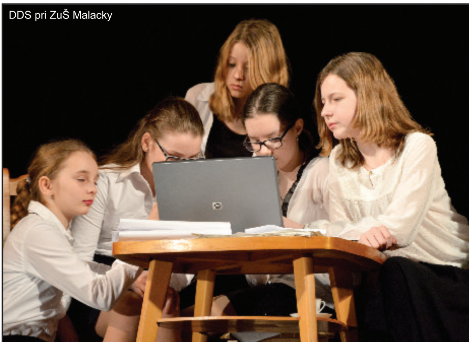
DDS pri ZUŠ Malacky