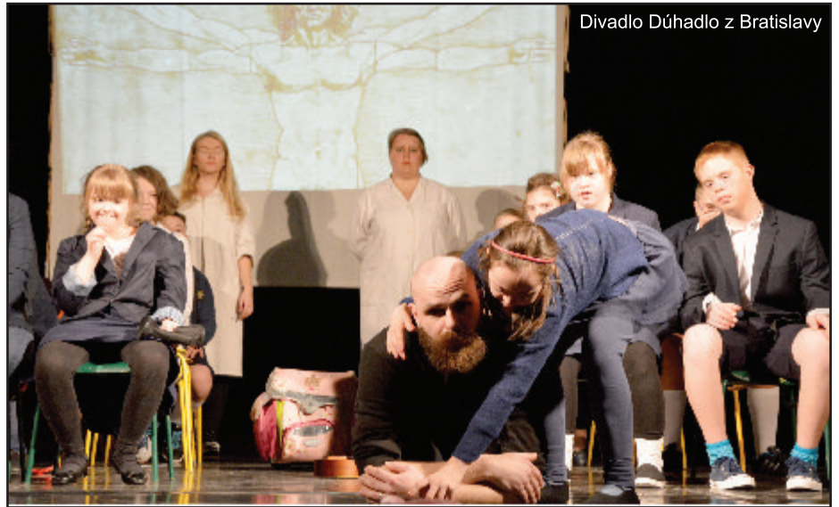
Divadlo Dúhadlo z Bratislavy