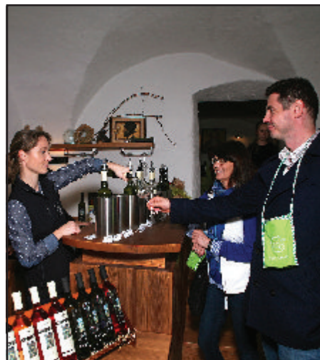
Dvojstranu pripravila: J. Dudová

Od 16. septembra aj osobne v Malokarpatskom osvetovom stredisku, Horná 20, Modra.