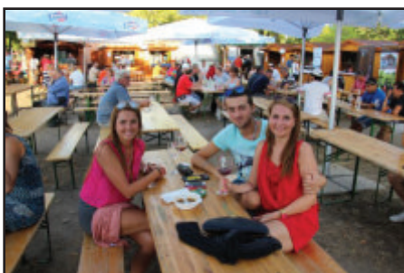
red.

Jur, Vinárstvo Pavelka & syn, Pezinok, Vinárstvo Bognár - Svätý Jur a Vínko Klimko - Modra. Okrem vína na festivale mohli návštevníci ochutnať výborné syry z Farmy Hiadlovský a nechýbali ani stánky s remeslami.