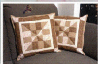
Zošívame a striháme štvorce

Pre tých, ktorí s patchworkom začínajú, ale aj pre tých, ktorí patchworkujú a chcú sa naučiť niečo nové, je pripravený zimný kurz.