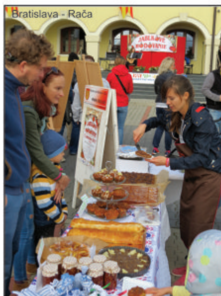
Bratislava - Rača