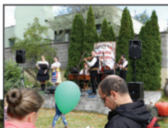
Devínska Nová Ves