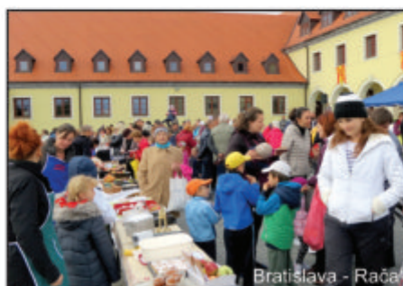
Bratislava - Rača