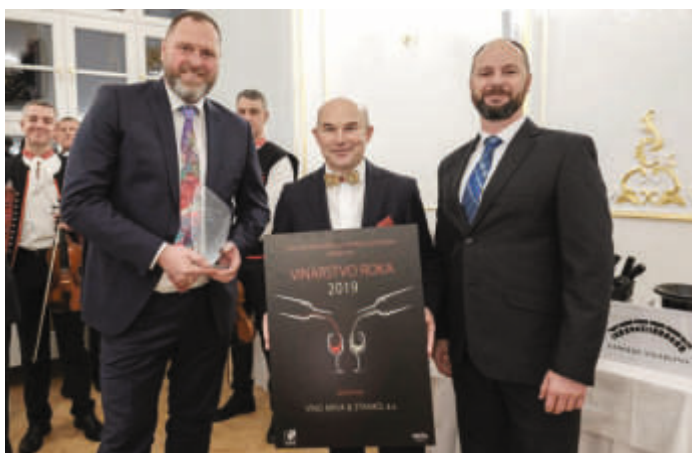
VINÁRSTVO ROKA 2019

Celkovo má zastúpenie v Národnom salóne vín 32 vinárstiev. Z pohľadu počtu vín, zastúpených v kolekcii Národného salónu vín, k najvýraznejším vinárstvám patrí Karpatská perla, Víno Matyšák, Villa Vino Rača, Zámocké vinárstvo. Z menších vinárstiev Dubovský & Grančič. Jednoznačne najväčšie zastúpenie vín v Národnom salóne vín, konkrétne osem, má spoločnosť Víno Mrva & Stanko.